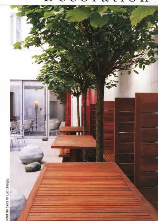
Hôtel de Sers

« À l'hôtel de Sers, le luxe est discret, confortable et chaleureux »