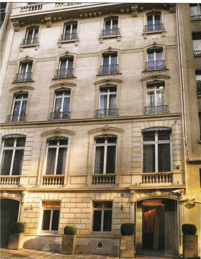
Hôtel de Sers