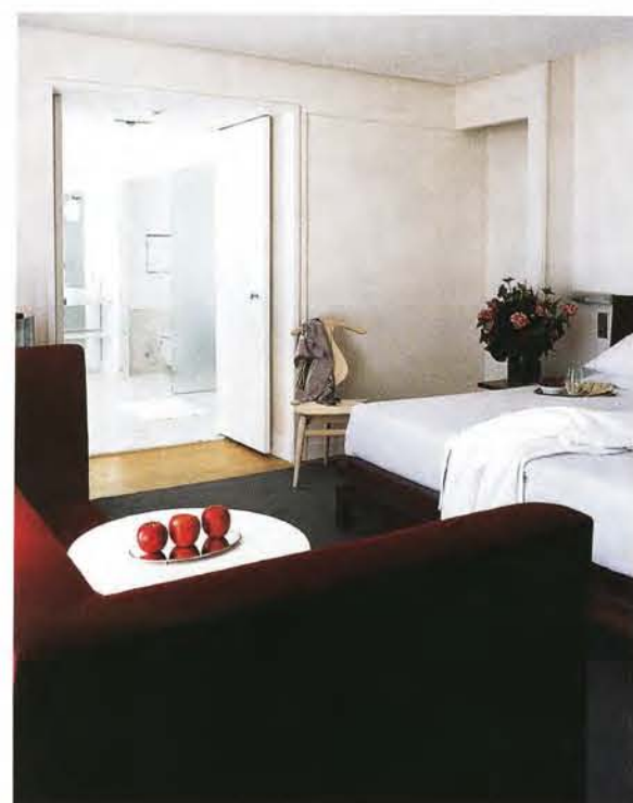
Hôtel de Sers

CI-DESSUS, DE GAUCHE À DROITE : La façade XIX e a été conservée. Le bar table sur une lumière tamisée et une ambiance zen. Le restaurant, sobre et raffiné, intègre parfaitement le staff d'origine restauré. La cour intérieure a été transformée en terrasse en teck. PAGE DE GAUCHE EN BAS : Les chambres sont largement ouvertes sur de grandes salles de bains.