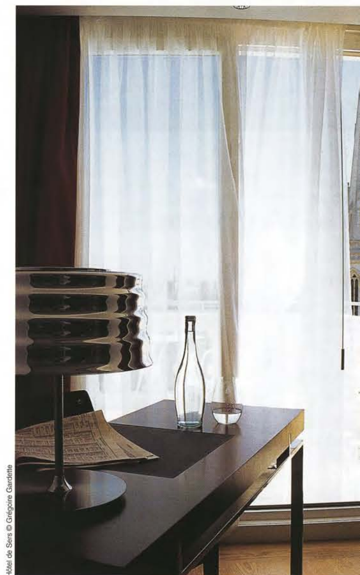
Hôtel de Sers